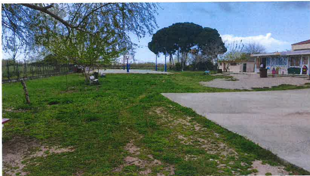
Εικόνα 1:ΑΠΕΙΚΟΝΙΣΗ ΤΟΥ ΟΙΚΟΠΕΔΟΥ

Πραγματοποιούμενη Δόμηση : 939,26 + 336,36= 1.275,62 μ 2